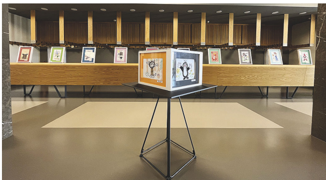
VÝSTAVA V DIVADLE OSKARA NEDBALA