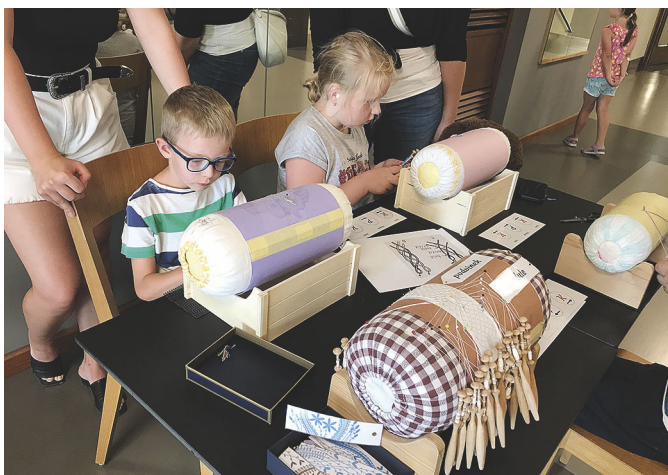
WORKSHOP V DIVADLE OSKARA NEDBALA