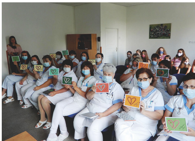
PŘEDÁNÍ SRDÍČEK VRCHNÍM SESTRÁM V TÁBORSKÉ NEMOCNICI