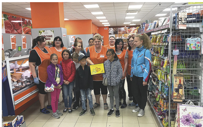
PŘEDÁNÍ SRDÍČEK PANÍM PRODAVAČKÁM V JEDNOTĚ V MALŠICÍCH