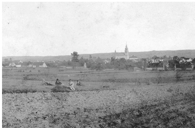
Nejstarší dochovaná fotografie Malšic, rok 1870