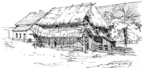
Malšice čp. 37 Sloupová kůlna uprostřed dvora s dvoukomorovou roubenou sýpkou v patře (in: Jihočeská lidová architektura. České Budějovice: Jihočeské nakladatelství, 1986).